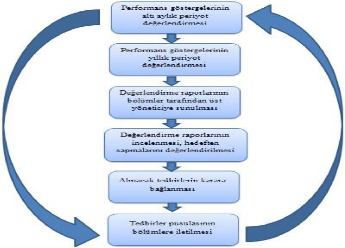
Şekil 2: Silivri İlçe Millî Eğitim Müdürlüğü 2015-2019 Stratejik Planı İzleme ve Değerlendirme Modeli

Raporlama Zamanı: İzleyen yılın Şubat ayı sonuna kadar.